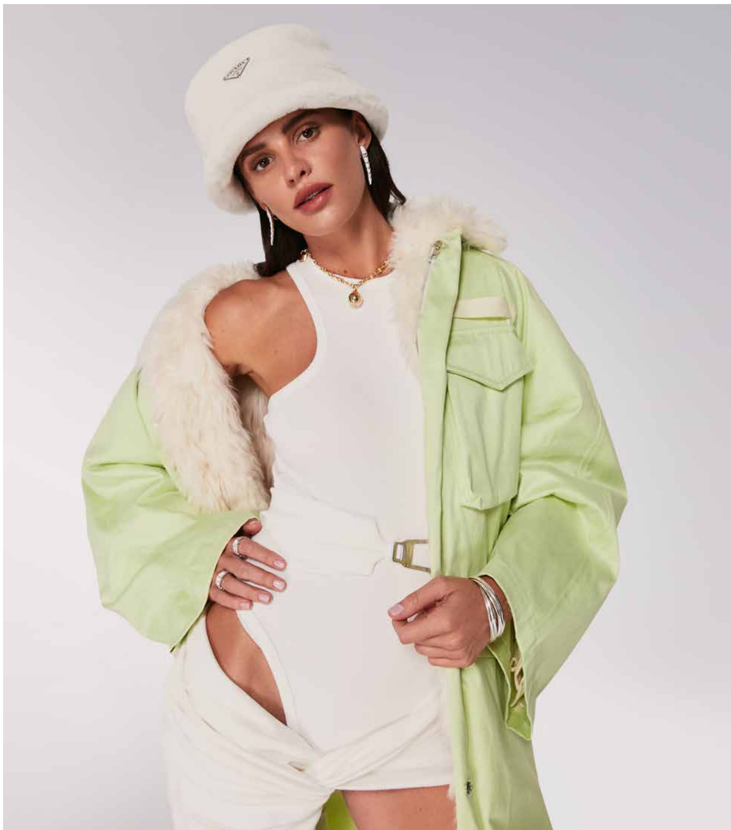
ПЛАТЬЕ ИЗ ХЛОПКА THE ATTICO . ПАРКА ИЗ ХЛОПКА THE ATTICO . БОТИНКИ ИЗ КОЖИ GIA COUTURE . ПАНАМА ИЗ ОВЧИНЫ PRADA . СЕРЬГИ И КОЛЬЦА BVLGARI . КОЛЬЕ И БРАСЛЕТ TIFFANY .