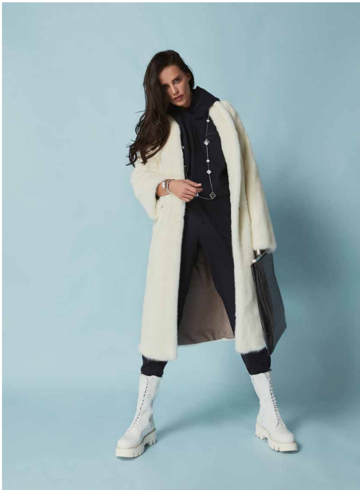
КОСТЮМ ИЗ ШЕРСТИ PRADA. ШУБА ИЗ НОРКИ BLANCHA. БОТИНКИ ИЗ КОЖИ PALOMA BARCELO. СУМКА ИЗ КОЖИ GIVENCHY. ПОДВЕСКА VAN CLEEF & ARPELS. БРАСЛЕТ BVLGARI.